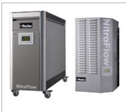
Generadores de gas nitrógeno de membrana NitroFlow basic

Consulte con su representante local de Parker para asegurar la selección de la solución correcta adaptada exactamente a sus necesidades.