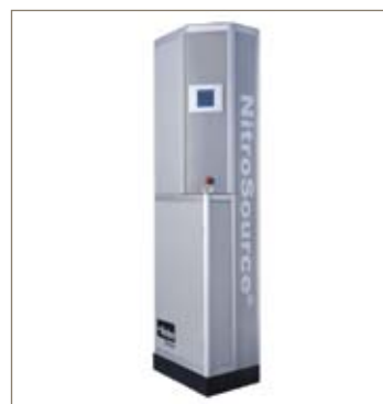
Generadores de gas nitrógeno de membrana NitroSource HiFluxx