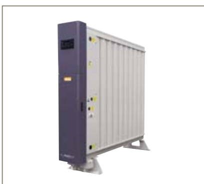
Generadores de gas nitrógeno de PSA MAXIGAS

Consulte con su representante local de Parker para asegurar la selección de la solución correcta adaptada exactamente a sus necesidades.