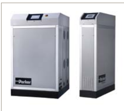
Generadores de gas nitrógeno de membrana NitroFlow