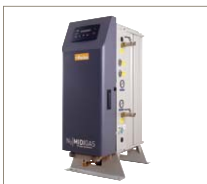
Generadores de gas nitrógeno de PSA MIDIGAS

La gama de generadores Parker incluye los siguientes modelos: